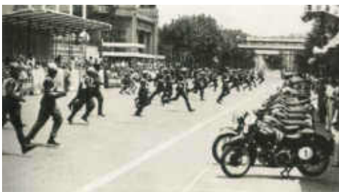
Sortida de les 24 hores de Montjuic del 1955