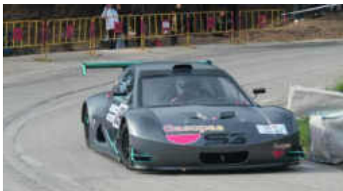
R. Plaus (Speed Car SS3) 3r CM PR i 4t Scratx

2.38.066. El segon de la categoria així com també de la general va ser Edgar Montellà (Speed Car GTR EVO) i el tercer va ser