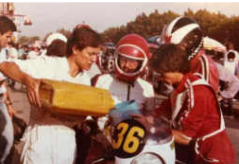
Aficionats amateurs corrien amb pocs mitjans

Malauradament, les 24 hores van acabar sentenciades el 1986, amb la tràgica mort de Mingo Parés. Les 24 Hores no es tornarien a celebrar més a la "Muntanya Màgica" i haurien d'esperar a la inauguració del Circuit de Montmeló, el 1991, per a tornar-se a celebrar