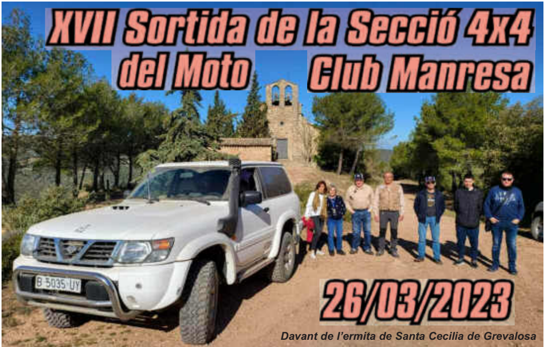
11 cotxes 4x4 vam fer aquest recorregut