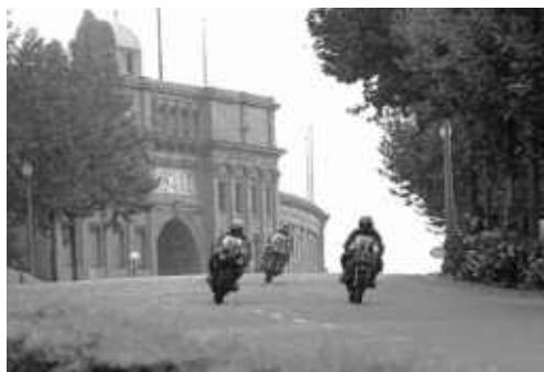
Mallol amb Montesa 250 passant l'estadi el 1974

El circuit de Montjuïc ja no era considerat segur a causa de les potents mecàniques i les grans velocitats dels vehicles que hi participaven, amb mitjanes de 120 km/h, que compro-