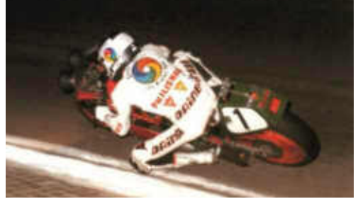
Joan Garriga amb Ducati guanyador el 1983

a partir de 1995, ara ja en un emplaçament específicament pensat per a la pràctica d'aquest esport amb tota mena de mesures de seguretat.