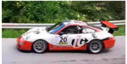
J.M a Soler (Porsche 911 GT3 997) 3r Turisme