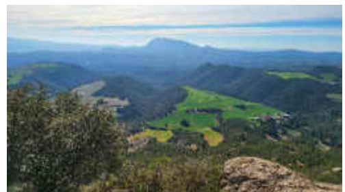
Vam gaudir d'unes vistes del bages maravoloses