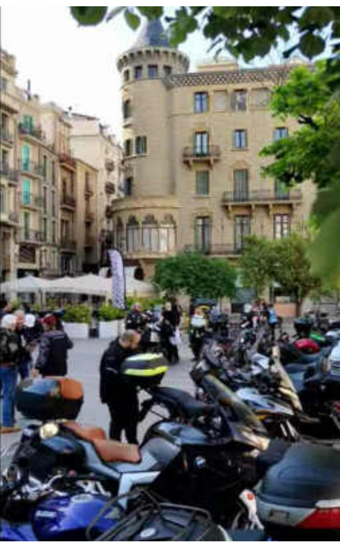
Les motos aparcades a la Plaça Sant Domènec

El dissabte 29 d'abril, a 2/4 d'onze del matí, es va dur a terme el Briefing de la Rider 2023. Com ja va passar el 2019, es va tornar a fer a Manresa, al Conservatori i les motos es van poder aparcar a la Plaça Sant Domènec. Donem les gràcies a l'ajuntament de Manresa i al mateix Conservatori per les facilitats que ens van donar per fer-ho. L'assistència va ser molt bona, tot i que coincidia amb els 100 Colls, una prova motorista que dura tot el cap de setmana. Però com que també s'estava oferint l'acte en streaming a través del youtube, la gent ens podia veure des de qualsevol lloc, tant en directe com en diferit. Sabem que fins i tot des d'Holanda, el grup Dodge Rangers, ens estava seguint durant l'explicació. En aquesta reunió l'organitzador i responsable Pep Requena va donar tota mena d'explicacions sobre el funcionament de la Rider, d'aquesta manera s'intenta evitar, el màxim possible, qualsevol tipus de problema el dia de la prova. Tothom va sortir content i ben informat