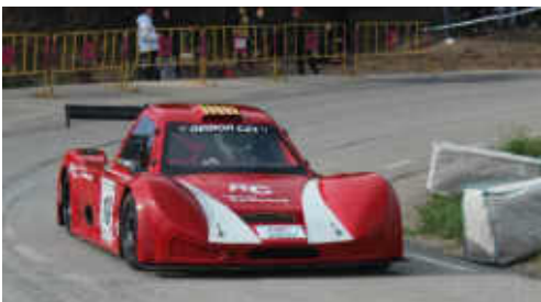
E. Carbonell (Demon Car) 5è CM PR i 8è Scratx

2.38.066. El segon de la categoria així com també de la general va ser Edgar Montellà (Speed Car GTR EVO) i el tercer va ser