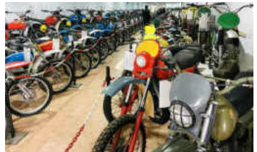
Part de l'extensa col·lecció de motos del museu

Les dues hores de visita establerta es van fer curtes per la gran quantitat de material que