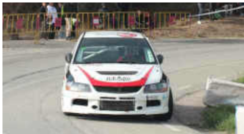
F. Jurado (Mitsubishi EVO) 3r Tur. i 16è Scratx