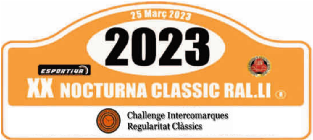
Sortida a Les Masies de Voltregà