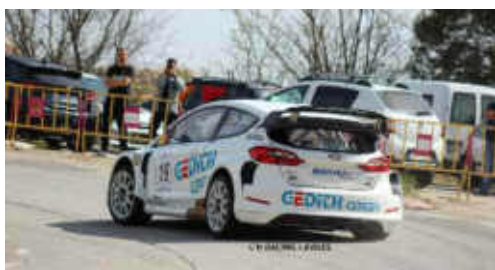
G. de la Casa (Ford Fiesta) 2n Tur. i 11è Scratx

El traçat d'aquesta cursa és bonic perquè es poden fer enllaçades molt bones i pots anar a fons, no és una carretera senzilla, però si tens bon motor, bona conducció i valor, pots donar molt gas. Aquest és l'escenari d'una cursa amb quasi un quart de segle de vida i puntua pel Campionat de Catalunya de Muntanya