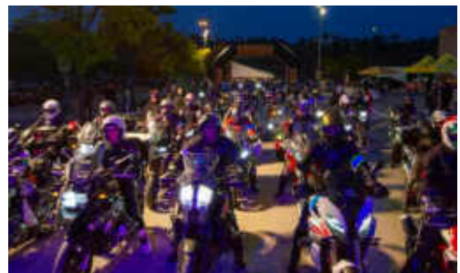
Moment que en Pep Requena va donar la sortida