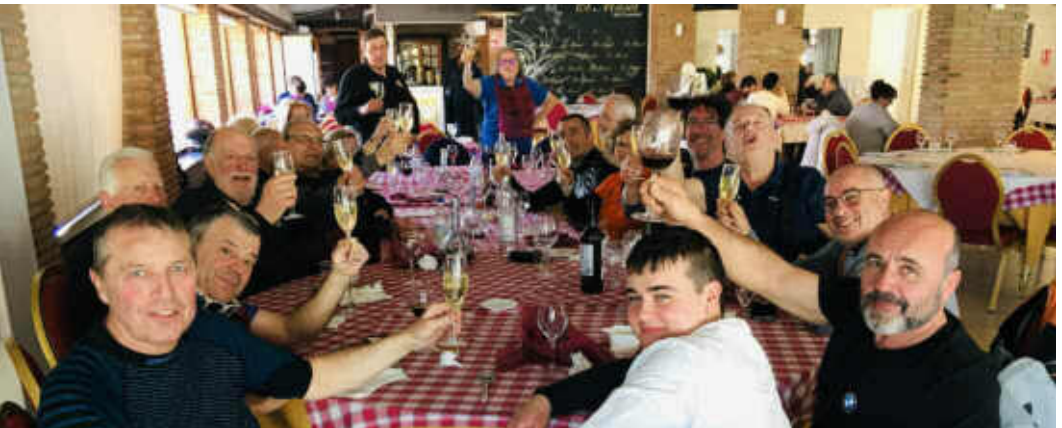
Gaudint del restaurant Maset de Montbrió amb una copeta de cava, un cop engolits tots el calçots

Retorn cap a casa, després de fer 300 km divertits i amb ganes de