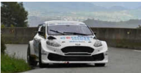
Gerard de la Casa (Ford Fiesta 017) 2n Turisme