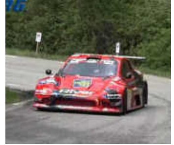
En CM Promoció: 1r - R. Plaus (Silver Car S3), 2n - Ian Porté (Silver Car S2) i 3r - (Speddcar GTR EVO)