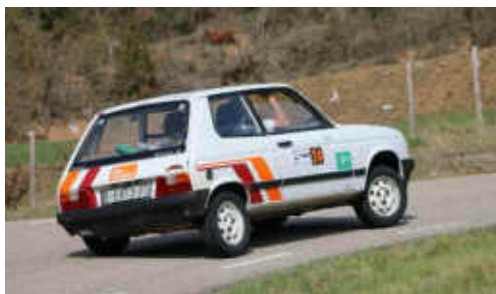
El Talbot representant al Moto Club Manresa

començar el tram estrella de 63,66 km, que finalment, per problemes tècnics de l'organització, només va ser de 25,12 km, anul·lant-se els 38,5 km restants. El guanyador absolut de la prova va ser l'equip de Clàssic Motor Club