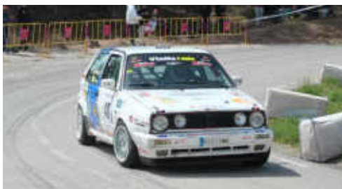
M. Serral (VW Golf GTI) del MCM 30è Turismes