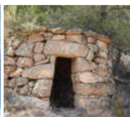
Barraca de pedra seca

metres. I cultural, visitant l'ermita de Santa Cecília de Grevalosa de l'any 1621, o la barraca de vinya o de pedra seca.