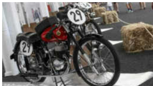
La Montesa Brio 125cc 1ª de la primera edició