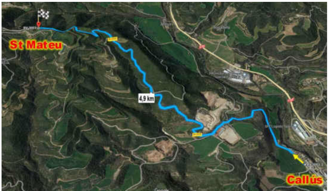
El tram revirat de 4,9 km entre Callús i St Mateu de Bages dóna moltes possibilitats als pilots valents

Tot i que era Sant Jordi, la pujada va anar molt bé, amb més participants que mai i un ambient molt festiu, tot i que un endarreriment provocat per un accident sense danys personals, va allargar la competició més enllà de l'hora prevista i el darrer vehicle va acabar cap