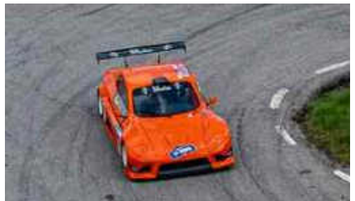
F. Brandao del MCM (Speed Car GTR) 2n CM+