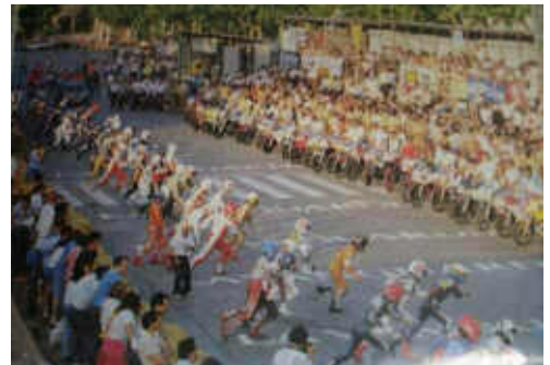
Els aficionats no van fallar ni en els últims anys

1 a -Montesa Brío 90 (1955), 2 a -Myma A1 125cc (1955), 3 a -Rieju 175 Sport (1956), 4 a -Lube NSU Max Spezial 250 (1956), 5 a -Montesa Impala Sport 250 Réplica (1963), 6 a -OSSA 230 (1967), 7 a -Bultaco 360 (1969), 8 a -OSSA 250 (1975), 9 a -Ducati 24 H. (1973), 10 a -Montesa Impala Blítz 250 Réplica (1972), 11 a -Montesa Rápita 250 Réplica (1974), 12 a -Yamaha FZ750 (1985), 13 a -Yamaha YZF R1 (2011)