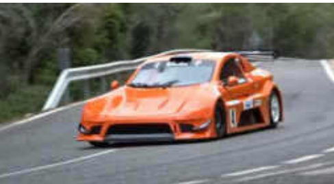
F. Brandao (Speed Car GTR) del MCM 2n CM+

A l'apartat de CM+ i Monoplaces el triomf