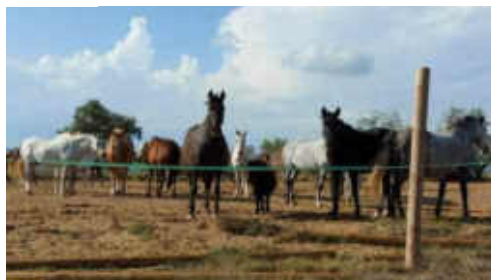
Els cavalls de Serra Morena a una altitud de 701m

Per acabar vàrem fer un dinar succulent de germanor a Igualada, al restaurant «Asador Mesón el Abuelo», amb un ambient de cordialitat i companyonia.