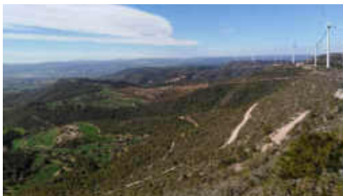
Vistes del parc èdic de les Tres Alzines a 838m

Una sortida també turística, com veure els cavalls de Serra Morena a una altitud de 701 metres, o El Cogulló de Cal Torre de 890