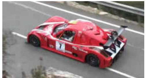
E. Carbonell (Demon Car) del MCM 4t CM Prom.