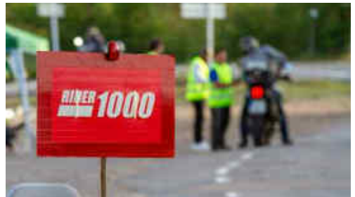
Les motos arribant al Congost després del repte