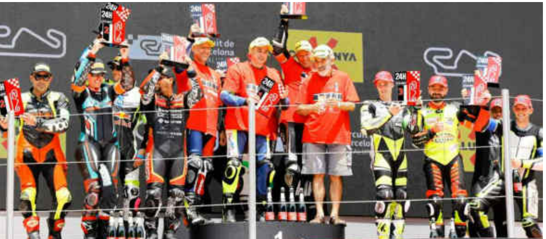
Podi Superstock 600: 1r l'equip Èxit amb una Yamaha YZF R 6 600, 2n Basomba Racing i 3r Dream RT