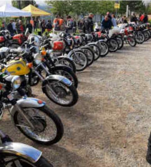
Molta varietat de motos clàssiques a Vilada