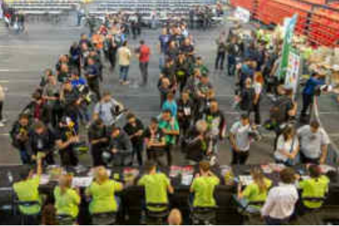
El dia de verificacions, molta feina i ben resolta