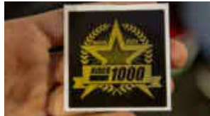
El pin dels punts Master

Volem agrair-vos la vostra il·lusió i perseverança per fer-ho possible. També volem reconèixer