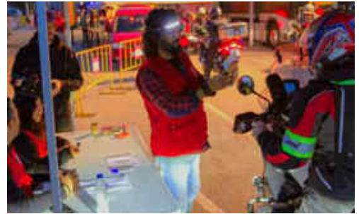
Els punts de control fan una feina primordial