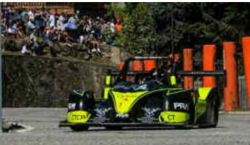
Montellà (Speed Car) 1r cat-3 CEM i 2n CM Prom