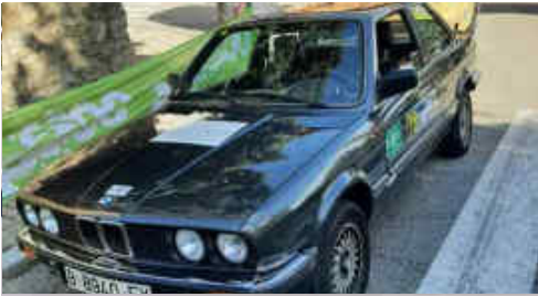
El BMW 318 de Ramon Martí a la pre-sortida

Els cotxes van començar a sortir a partir de les deu del matí de la població d'Alp cap l'estació d'esquí de Masella per la carretera GI-400, un total de 6,038 kilòmetres de cursa en els que hi havia molta afluència de públic. A destacar que les primeres corbes de la pujada