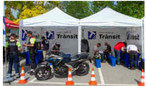
L'estand de Transit va fer cursets de seguretat