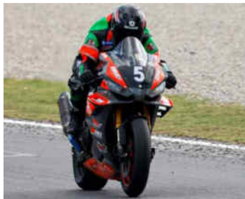
El MPS NrBike francès, 3r Gen. i 1r Open SB