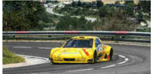
T. Arrufat (Silver Car S3) 2n CM PR i Scratx