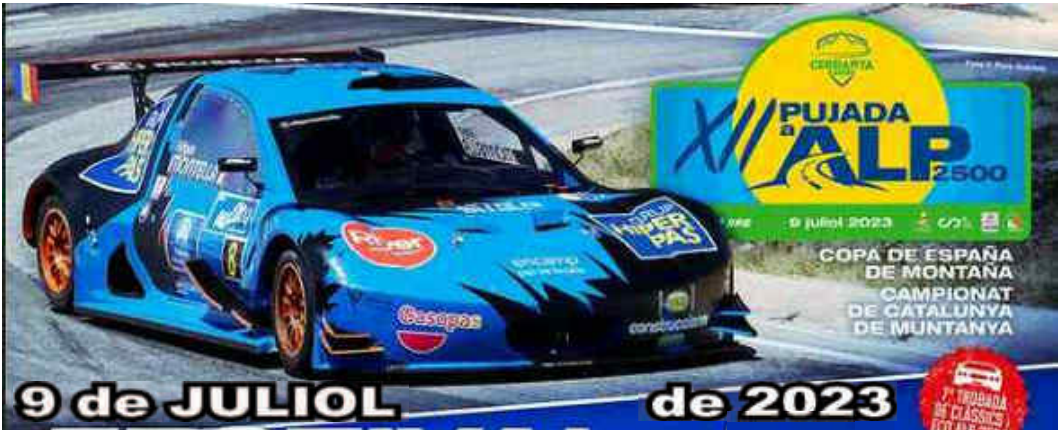
Gonzalo Cabañas (NOVA NP03) 1r cat-2 CEM