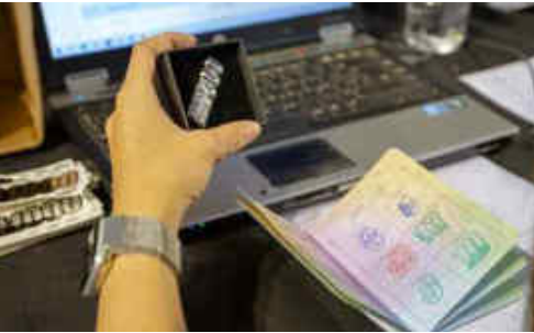
El pin que rep el pilot amb el passaport ple

la gran tasca de tots els membres dels punts de control i dels punts de control màster, ja que sense totes aquestes persones el repte de la RIDER1000 no seria, ni molt menys, el mateix