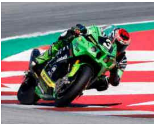
El Kawasaki Català Aclam, 2n amb remuntada