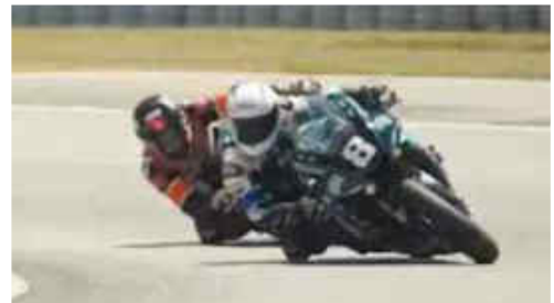
El Bimtrazer Fly basc, 5è General i 3r Open SBK

Miralles). La formació catalana era candidata al podi absolut, i la seva quarta posició en la classificació del divendres ho confirmava. Aquesta posició era justament la que ocupaven a l'inici de la prova, fins que una caiguda