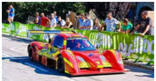
Jaume Vilardell (Bango) retirat per un accident