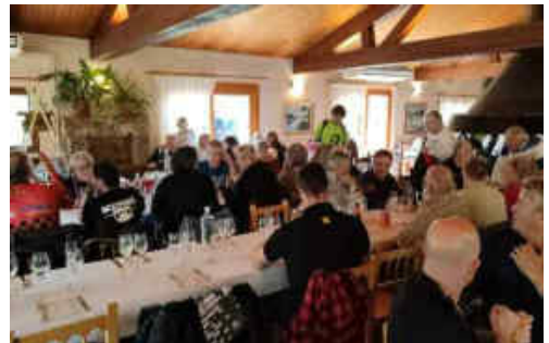
La Trobada va acabar amb un dinar de germanor al restaurant Cal Candi pels més de cent participants