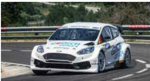
Gerard de la Casa (Ford Fiesta) 2n Turismes