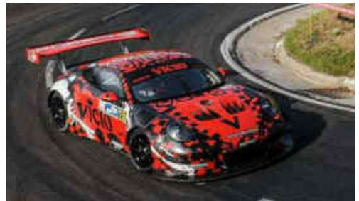
La Cerdanya va gaudir de tres dies de motor