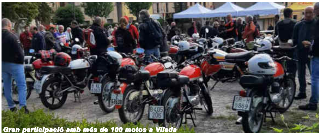
Gran participació amb més de 100 motos a Vilada

Més d'un centenar de motos clàssiques es van aplegar a Vilada el dissabte 20 de maig per participar en l'onzena edició de la Ruta de les 30 Paelles.