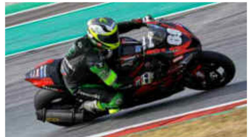
Box 69 Racing Marvea, retirat al trencar motor