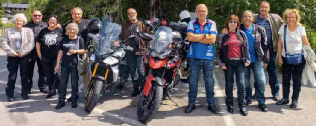
Els companys de la secció OPEN MOT (Organització de pensionistes Motards) que van anar als Pirineus

El diumenge 9 de juliol sis parelles de l'OPEN MOT (Organització pensionistes Motards) vàrem fer una sortida motera, organitzada per les dones d'alguns dels motoristes d'aquesta secció del Moto Club Manresa.