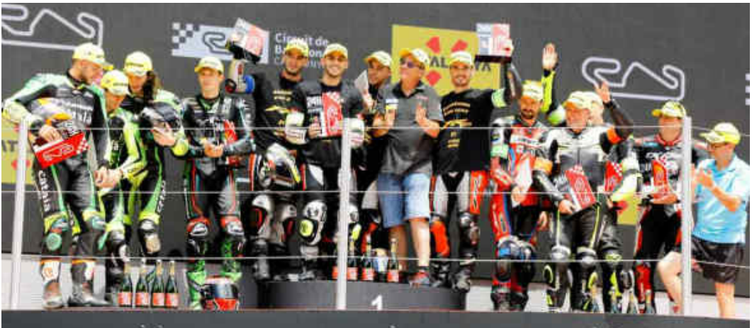
Podi: 1r FR Moto (Yamaha YZF) 2N Kawasaki Català Aclam (KaW ZX10R) 3r MPS NrBike (Aprilia RSV4)