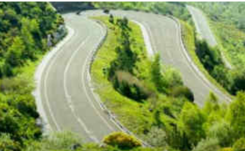
El traçat i paisatge d'aquest any ha agradat molt

Al Congost hi havia muntat des del divendres un bar amb taules i cadires repartides pel davant del pavelló i bastants estands comercials, també el del Moto Club Manresa, per vendre cadascun els seus productes. Aquest any la Rider1000 va col·laborar amb el Servei Català de Trànsit, ANESDOR i TCC per oferir les millors eines quant a seguretat, així, durant