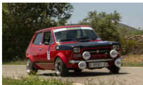
D.Escola / A.Zayas 1r F i 2n Scratch (Seat 127)

un reagrupament a Perafort i cap el 5è tram Mont-ral de 26,25 km, 6è Vall del Silenci de 21,21 km i el 7è, l'últim i mes llarg, La Febró de 37,24 km, que enguany donava punts addicionals a la classificació scratch del campionat als 5 primers classificats del tram. Després d'un dia de força calor, a partir de quarts de vuit del vespre, van anar arribant els equips a la població de Perafort, final de la cursa. El guanyador absolut de la cursa i al mateix temps del grup H va ser l'equip de Karbar Eternity, format per Marc Céspedes i Carles Turón amb el seu Ford Fiesta XR2 MK2 1600, el 2n classificat scratch i guanyador de grup F