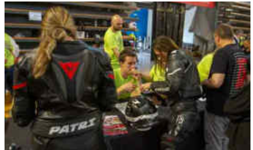
Rècord de dones riders i acompanyants el 2023

de 300 km, acollint així els més de 2.500 inscrits en total. També volem destacar i reconèixer el paper femení en aquesta Rider, havent batut el rècord de dones riders i acompanyants