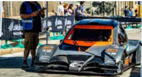
Santi Guitart (Demon Car) 2n CM Promoció