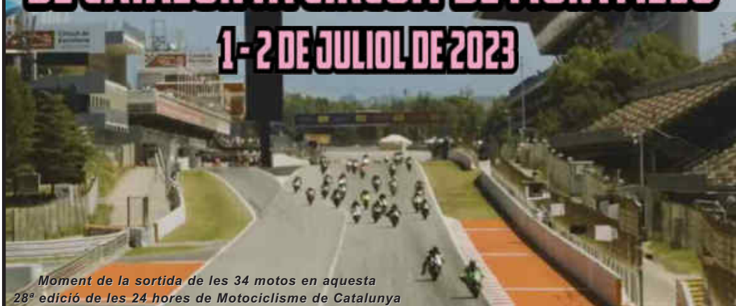
Moment de la sortida de les 34 motos en aquesta 28ª edició de les 24 hores de Motociclisme de Catalunya

Els dies 1 i 2 de juliol es va celebrar la 28a edició de les 24 Hores de Catalunya de Motociclisme, un total de 34 formacions van participar al Circuit de Barcelona-Catalunya per aconseguir la victòria de la mítica prova.