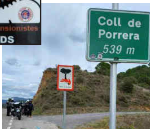
La ruta va ser molt revirada i amb grans vistes