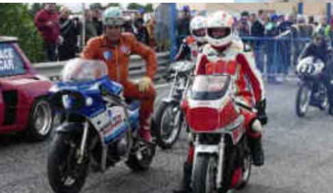
Pilots llegendaris van muntar les seves motos