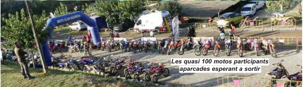
Les quasi 100 motos participants aparcades esperant a sortir

Pel que fa a l'apartat infantil, altrament anomenat Enduret, que també era puntuable per la Copa Catalana, va comptar amb 55 inscrits, que estaven dividits en les categories de 50 cc, 65 cc, 85 cc Cadete, 85 cc Juvenil,