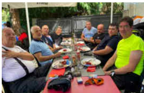
Dinant diumenge al poble francès de Chaum després d'una llarga ruta per ports i muntanyes pirinaiques