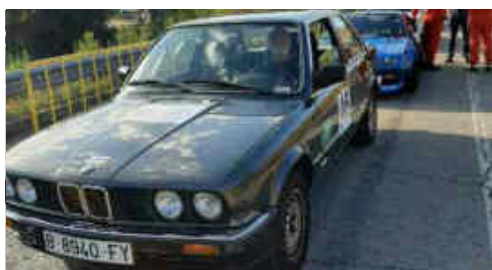
El BMW 318 de Ramon Martí a la pre-sortida

partir de 2/4 de 10 del matí, van sortir per fer el recorregut de 6,040km que uneixen les poblacions de Gironella i Casserres. Per 3r any consecutiu la sortida es feia des del vial