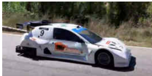
Ian Porté (Silver Car S2) 3r CM Pr i 5è Scratx