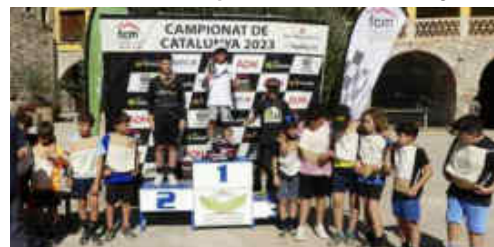
Al final els guanyadors van rebre les medalles