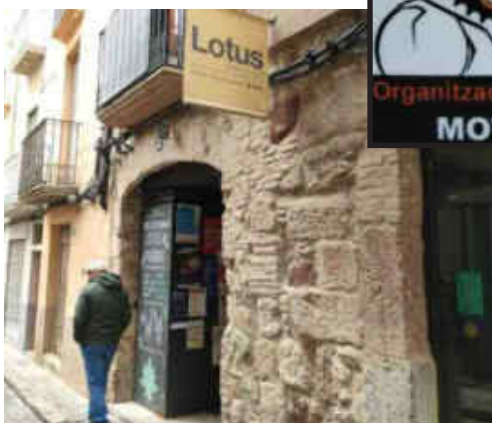
Vam dinar al restaurant Lotus, al cor de Falset

Per la tornada vam passar per Alforja, La Selva del Camp, Alcover, El Sarral, Rocafort de Queralt, Santa Coloma de Queralt i Manresa. Al final vam fer un total de 302 quilòmetres i alhora vam gaudir d'un dia de germanor, amb una estupenda companyia, bon menjar i una ruta magnífica de corbes amb un esplèndid paisatge.