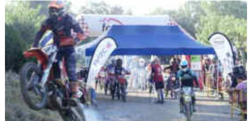
Els corredors estaven dividits en 8 categories