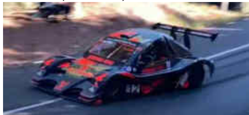
F.Brandao (Silver Car S2F) 11è Scratx 2n CM +