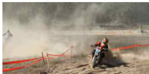
Tot i la pols que aixecaven seguien sent visibles