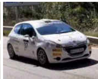
Comaposada (Peugeot 105) 1r cat.1 J.Torres (BMW 320) 1r Propulsió J.Fornell (Peugeot 208) 1r cat.2