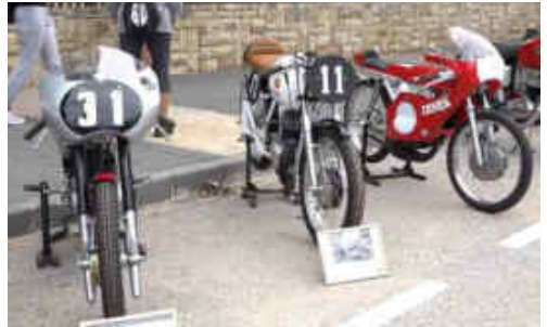
Les Montes Impala i FOPI i la Derbi Ran 50cc