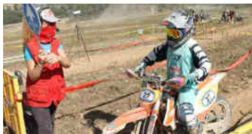
Sortida de l'especial, molt més sec i empolsinat