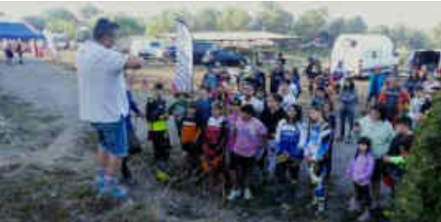
Donant instruccions als joves abans de la cursa

Femenina-A, Femenina-B, Sub 16 i Elèctrica. Els nens van demostrar molt nivell i oferint un bon espectacle. Això si, degut a la sequera continuada, va ser una jornada amb molta pol-seguera, però això no va deslluir la prova.