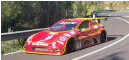
T. Arrufat (Silver Car S3) 2n Scratx i CM PR