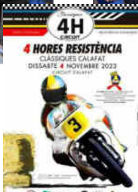
Cartell oficial de la prova

van ser: Clàssic SSP Motos anys 1987-1989, Clàssic 500 Moto Fins any 1985, Clàssic SBK Motos anys 1987-1989, Classic 1000 Motos Fins any 1979, Clàssic 24H Motos anys 1980-1986.