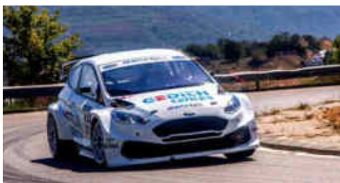
G.de la Casa (Ford Fiesta) 2n Tur. i 8è Scratx