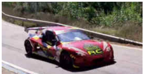
R.Coello (Speedcar GT1000) 11è Scratx i 3r CM+