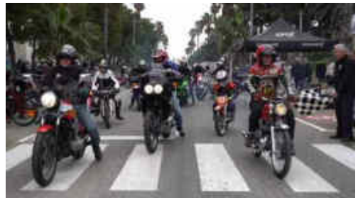
Hi havien motos de moltes categories i èpoques