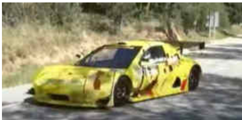
T. Arrufat (Silver Car S3) 2n CM PR i 4t scratx