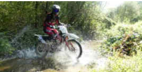
L'Enduro repetia 2 cops 2 trams ben diferenciats