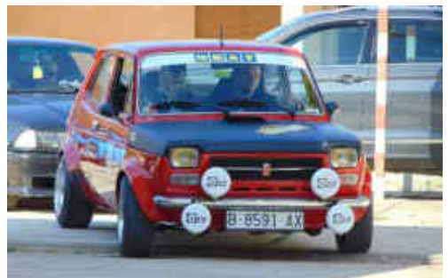
D.Escolà/ A.Zayas (Seat 127) 1r F i 13è scratx