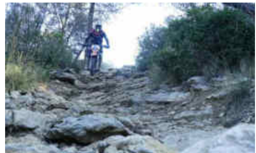
En alguns trams s'havia d'anar molt en compte