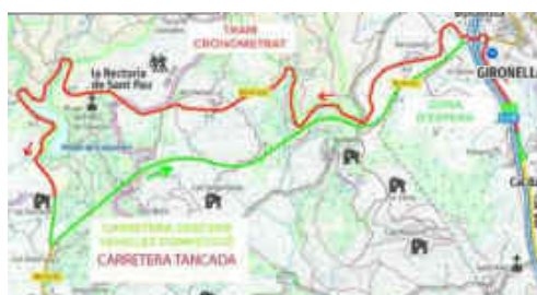
Traçat de la Pujada Gironella Casserres