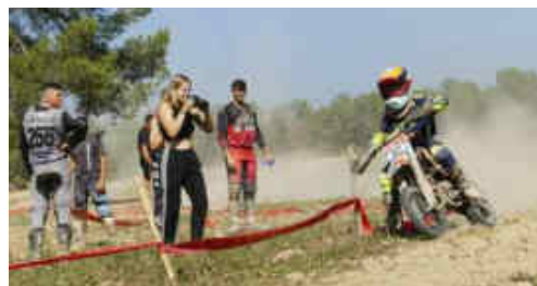
Els familiars i altres pilots observaven als joves