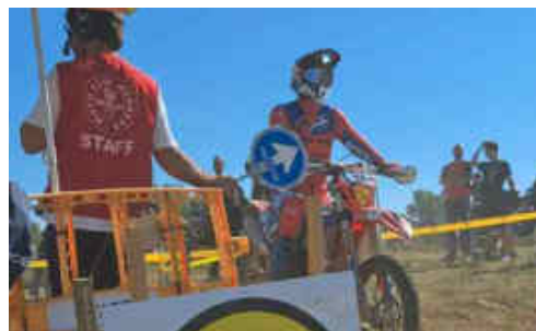
La sortida a les especials eren envoltades de pols