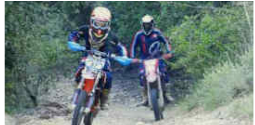
Segons l'edat els pilots anaven acompanyats