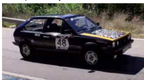
E.Falgas 1r Regularitat (VW Polo Coupe GT)