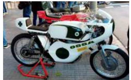
La Ossa Copa 250 Competición i una Derbi Ran