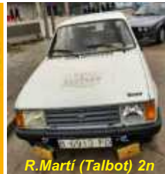
R.Martí (Talbot) 2n