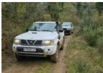
La vegetació reflectia les pluges