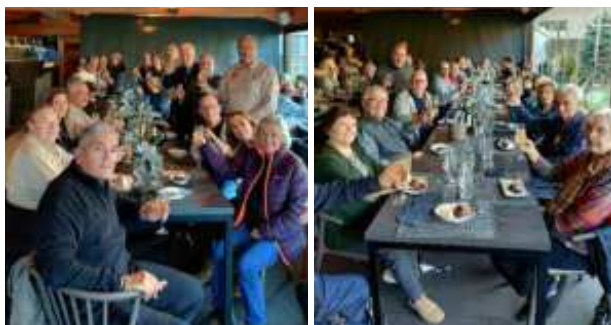
Gaudint del excel·lent dinar del restaurant Sol i Cel

total de desnivell positiu de 1.334 metres, després per carretera fins a Cal Rosal, on vàrem dinar al Restaurant Sol i Cel, amb un excel·lent menjar i un molt bon servei. Després d'una bona sobretaula emprenguérem la tornada cap a casa per carretera.