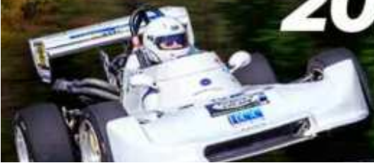
Toni Arrufat (Silver Car S3) 1r Scratx i CM Prom