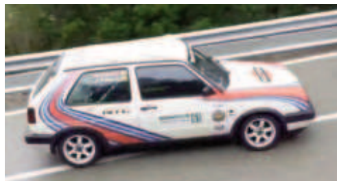
Jordi Pitarch (VW Golf GTI) 1r Regularitat Sport

En Regularitat Sport va guanyar el pilot de l'escuderia Baix Camp Jordi Pitarch amb Volkswagen Golf GTI. A partir de les 6 de la tarda es va fer el lliurament dels trofeus, donant per acabada la cursa.