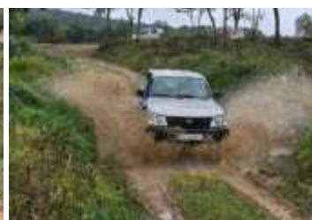
Vam passar per bastants fangars