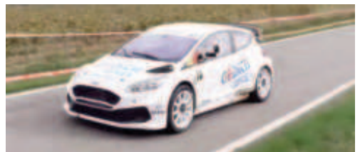
G.de la Casa (Ford Fiesta) 5è Scratx 2n Turisme