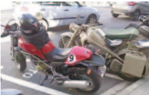
Ducati Monster i Zundapp Ks750 dels anys 40