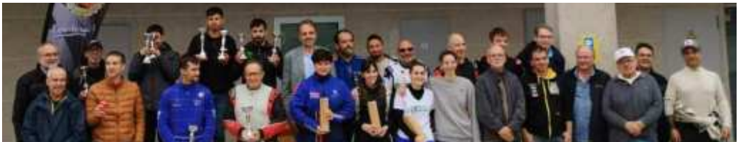
Foto dels 28 participants al 1r Slalom Ciutat de Manresa celebrat a Sant Fruitós de Bages