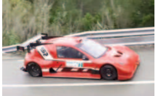
F.Brandao (Silver Car S2F) 3r scratx i 2n CM+