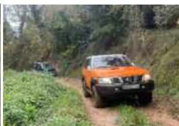
El paisatge era verdós i humit