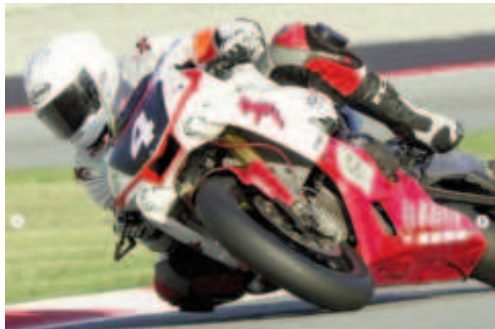
L'equip Yamatube Folch Endurance van ser 6ns

junt de Reus se li van acumular contratemps com el sobreescalfament, una cadena destensada o problemes amb les llums.