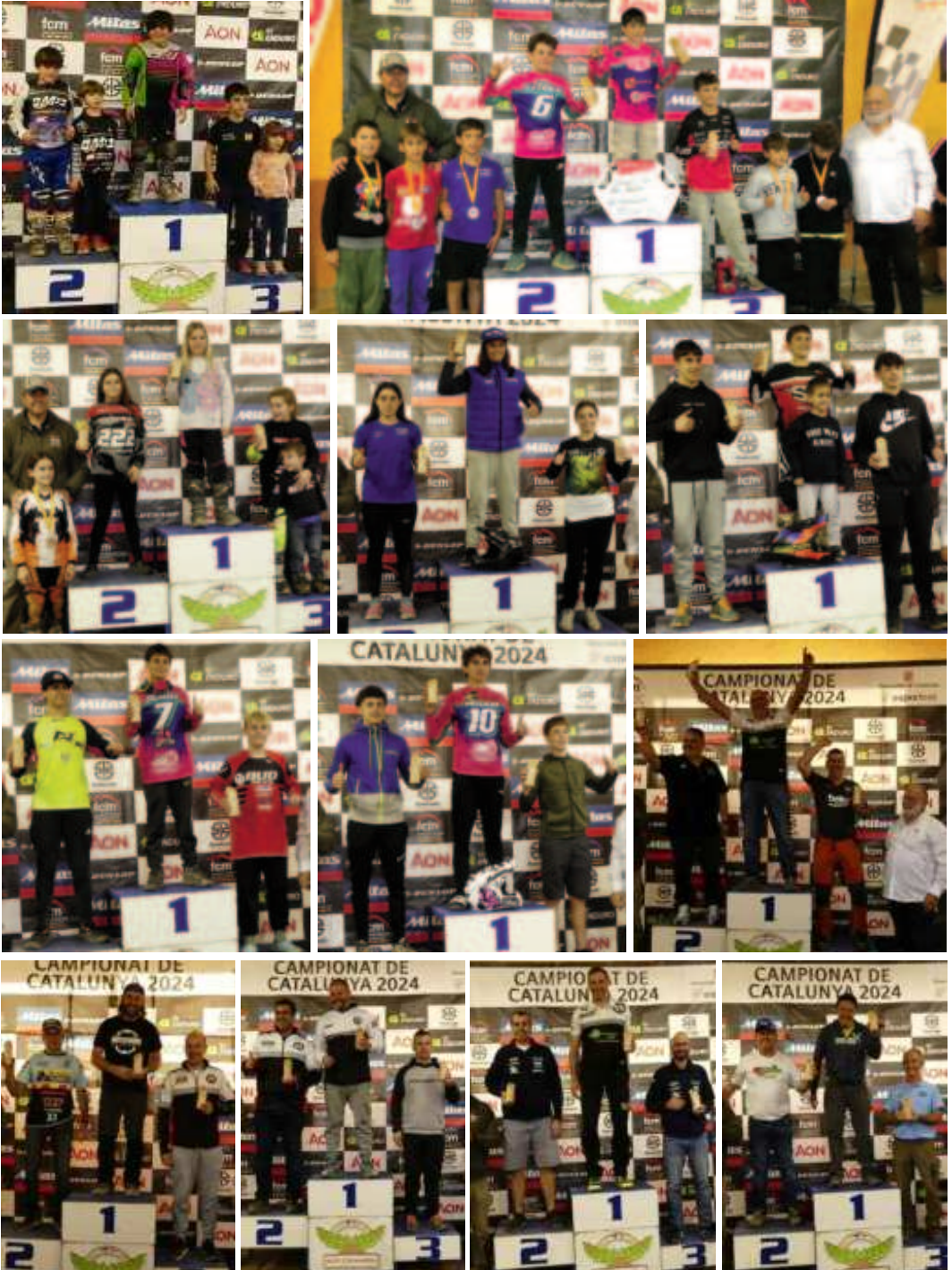
Les últimes 5 fotos són els podiums de l'Enduro clàssiques en les seves diferents categories

Cares de felicitat en tots els podis de totes les categories d'aquest Enduret de Navarcles