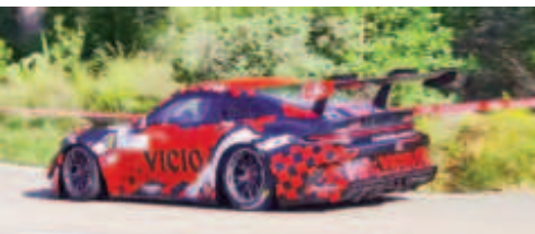
Jordi Gaig (Porsche 911) 3r Scratx 1r Turismes