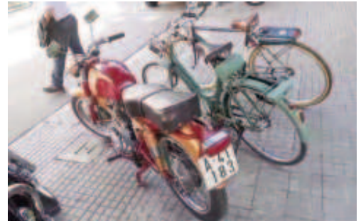
Ducati 175 amb dues bicis antigues amb motor