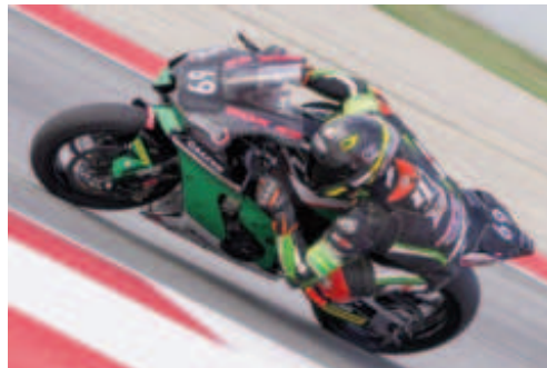
Box 69 Marvea de Sabadell van quedar 4ts

El Box 69 Racing Marvea ocupava la vintena plaça en la sortida, però des dels primers compassos ha estat un habitual en el top 5. Abans d'entrar en la fase nocturna, els catalans estaven entre la segona i la tercera plaça de les classificacions, una posició que han mantingut fins a les 5 de la matinada. Sense cap dubte, el Box 69 Racing Marvea passa a ser considerat un dels equips a tenir en compte en cada edició de les 24 Hores de Catalunya de Motociclisme, amb una regularitat envejada per molts dels seus rivals.