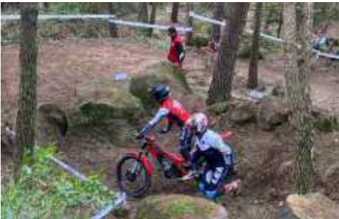
Can Taulé ofereix zones boscoses naturals

La Federació Catalana va desplaçar un equip tècnic per les inscripcions, cronometratge i classificacions, la part de controls de zones va anar a càrrec del MCM amb els seus