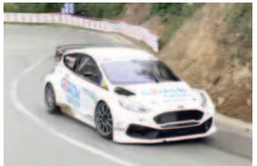
G.de la Casa (Ford Fiesta) 6è scratx i 1r Turisme

Pel que respecta als CM Promoció el triomf va ser per Jordi Vilardell (Demon Car R 32 EVO), seguit d'Edgar Montellà (SpeedCar GTR Evo) i per Ramon Plaus (Silver Car S3 PEP) en tercera posició. En Jordi, amb aquest resultat, s'ha coronat campió de Catalunya de Muntanya de CM PROMO, guanyant totes les pujades en les que ha participat