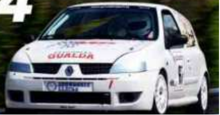
J. Galofré (Speed Car GT1000) 4t Scratx 2n CM+