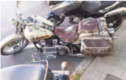
Van portar aquesta super espectacular Harley

mes de setembre. Tot va estar amenitzat per un bon esmorzar, gratuït pels que van aportar motos a l'exposició. Vam tenir més de 35 motos exposades al carrer pel gaudi dels vianants, que quedaven meravellats amb la exposició. També vam tenir un cotxe d'època