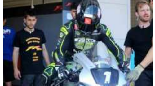
L'equip local FR Moto Racing Team va ser 3r

fugaçment, ja que els mundialistes estarien parats prop de 8 minuts en el box solucionant alguns problemes tècnics. En aquest context, el BMD Performance-B Motorsport s'ha dedicat a traçar una ruta directa cap al triomf final, aconseguint la seva segona victòria i tercer podi en la prova amb un total de 762 voltes completades, un nou rècord absolut.