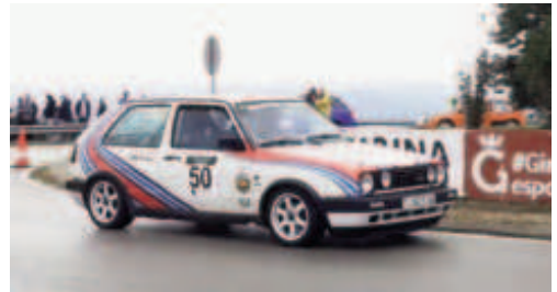
J.Pitarch (VW Golf GTI MK2) 1r Regularitat Sport