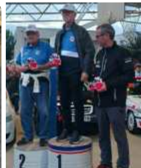
Dalt SantMartí 3r R./ Baix Pitarch 1r R.S