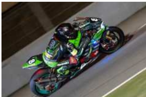
El Team Bolliger Switzerland van se 2ns