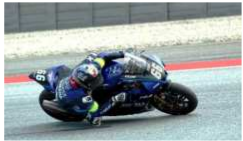
Els guanyadors amb la seva Yamaha YZF R-1