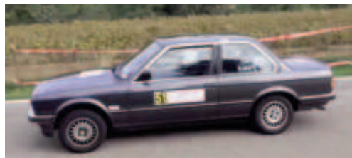
JM a Martí (Seat 131) 2n Reg.S- 3r Camp.Catalunya