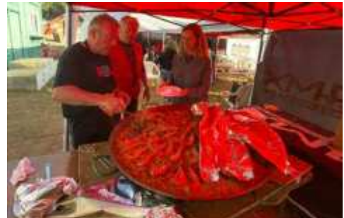
Al final del trial es va gaudir d'una bona paella

Finalitzada la prova i un cop l'equip federatiu va tenir les classificacions, es va procedir al repartiment de premis a càrrec del president i vicepresident de Moto Club Manresa i el representant de la FCM