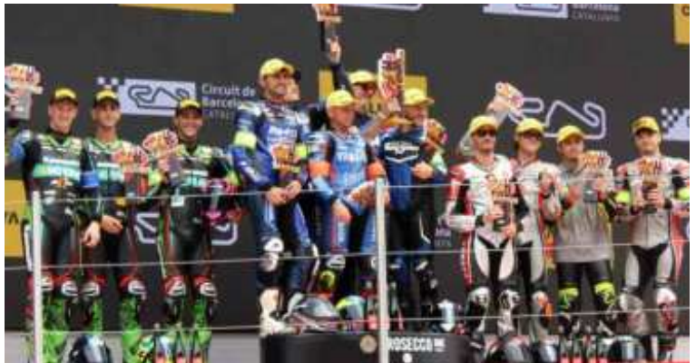
1r BMD Perform. B - 2n Team Bolliger Switz. - 3r FR Moto Racing Team

Però en la resistència res està assegurat i