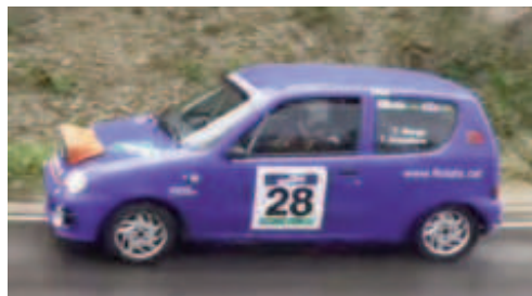
Tomás Berga (Fiat Seicento SPC) 5è Grup 1