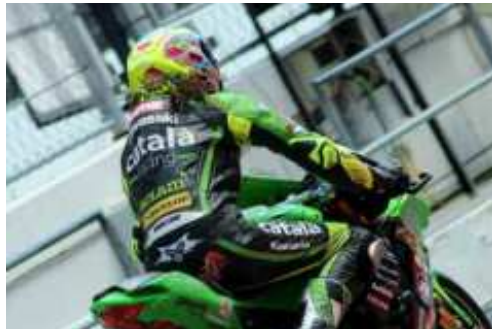
El Kawasaki Català Aclam es van haver de retirar