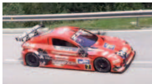
E.Montella (Speedcar GT-R) 2n CMPR i 3r Scratx