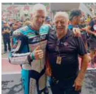
El nostre president no va faltar a la cita, visitant pilots i Boxes

La 29a edició de les 24H s'ha caracteritzat per tenir una de les xifres de participació més altes dels últims temps, amb un total de 54 equips inscrits i 219 pilots. A més de la quantitat, també hi ha hagut qualitat, amb fins a quatre formacions provinents del mundial d'endurance. Això ha provocat que tots els equips s'espremin al màxim, amb unes quatre primeres hores d'infart. Malgrat això, han estat un total de 9 les formacions que han signat la seva retirada de la prova.