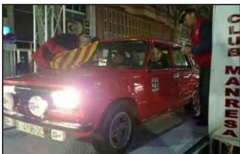
Els dos Roca del MCM amb el seu SEAT 124 FL

trenta-tresena, trenta-cinquena, trenta-sisena i trenta-setena posició de la classificació general, de la que en va ser el guanyador absolut l'equip de l'escuderia GTAm, format per Sergi Giral i Magdala Prats, amb el seu Volkswagen