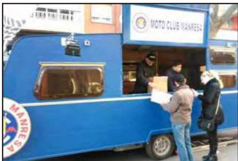
Stand del Club al Passeig donant informació