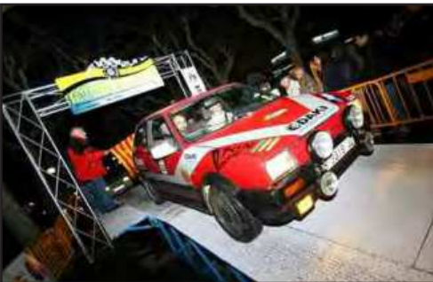
SEAT Ibiza de Pedrals / Hueso, 1rs del grup S

Bruguera" de 13,33 km i el tercer, que era el mes llarg i selectiu, per Rocafort-Esternalles de 28,32 km. La prova finalitzava a Torruella de Baix, sobre les onze de la nit, després de fer dues passades pels trams. Aquesta vegada, l'equip habitual de Moto Club Manresa, va