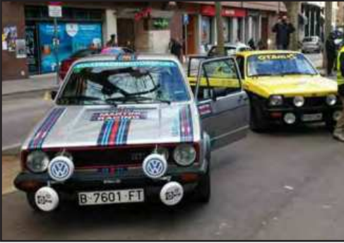
VW Golf MK1 de Giralt / Prat, 1rs del grup A