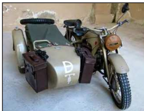
Zundap de guerra del 1936 de M.Valdespina