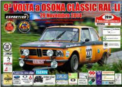
Cartell oficial de la 9ª Volta a Osona