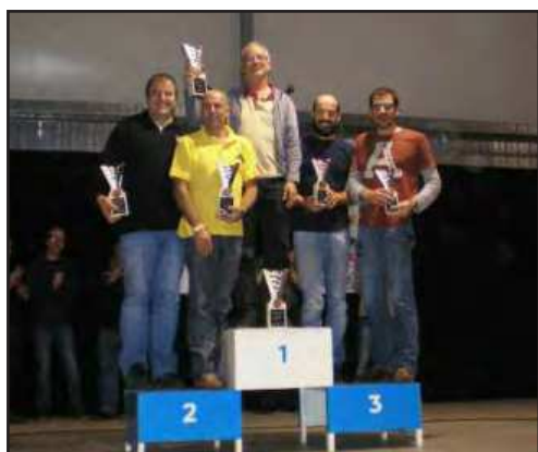
Podi dels corredors de la classe A (sense aparells)

La pluja ens va acompanyar, fent-nos la guitza