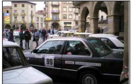
BMW de Marti / Santamaria, 1rs classe A