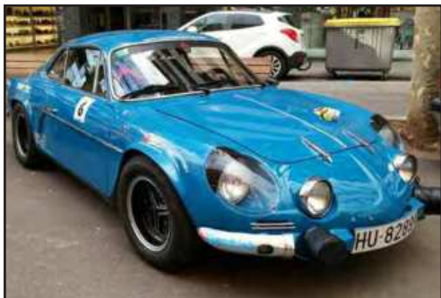
El Renault Alpine d'Estrada / Teixidor del MCM

declinar la seva participació per involucrar-se en les tasques organitzatives, tot hi així, el Moto Club va inscriure 5 equips: Fidel Estrada i Lluís Teixidor amb Renault Alpine, Benet Salvans i Carme Corroero amb Porsche 911,