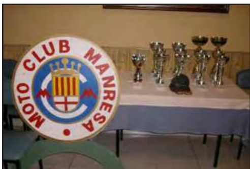
Les copes preparades per ser lliurades