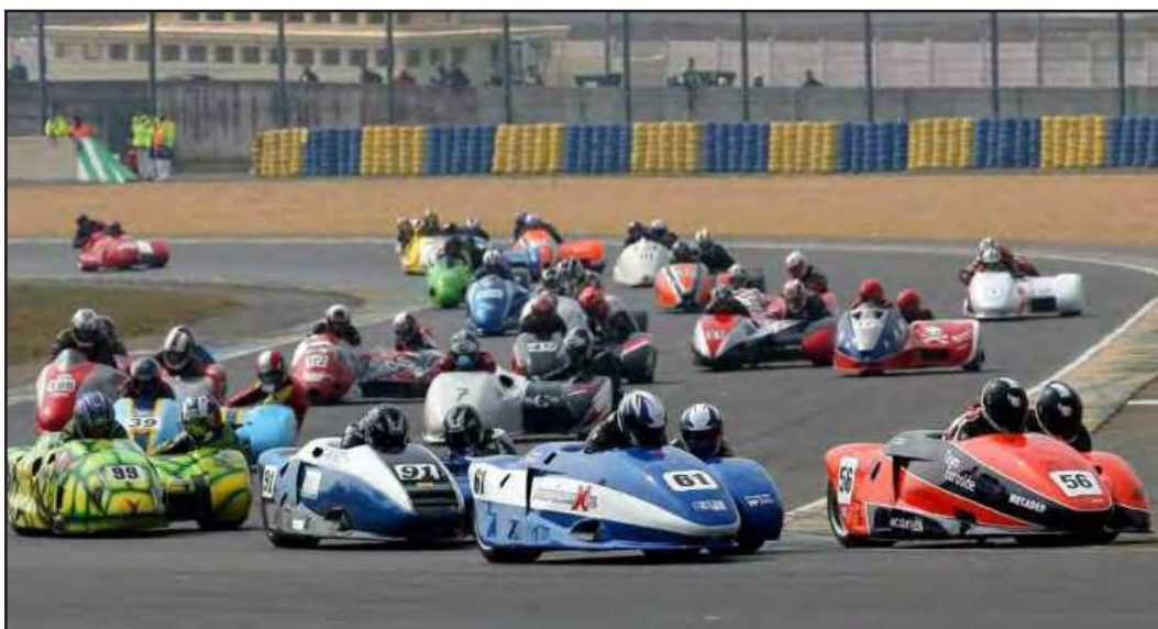
Cursa dels sidecars F2