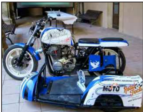
Sanglas Acrobatic Sidecar Show de A.Rubies