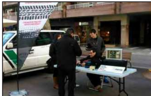
Els cronometratges de la prova els duia Iteria RC