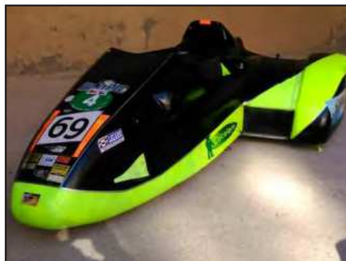
Chasis monocasco Seymaz, motor Suzuki 1000