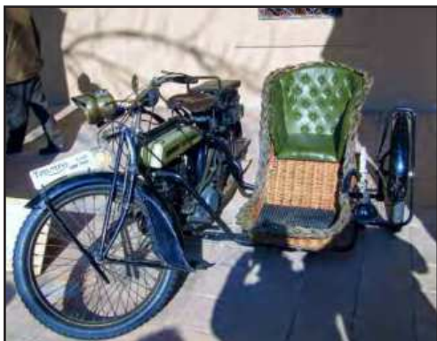
La Triumph de 1915 amb sidecar de vimet