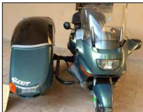
BMW K1200LT side Flexit, amb xassis oscil·lant