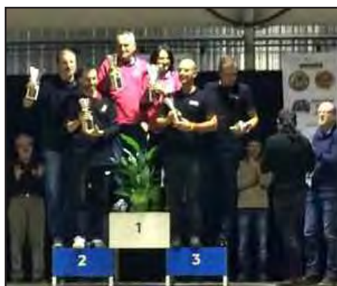
Podi dels corredors de la classe B (amb aparells)