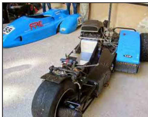
Side F1 Suzuki amb chasis monocasc LCR