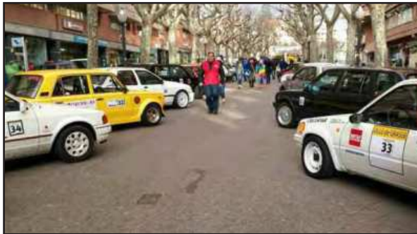
El passeig Pere III feia goig amb tots els cotxes exposats

d'altres coses. Per tot això, Moto Club Manresa va organitzar el 31 de gener la primera prova de les dues que ha de constar aquest mini-campionat. En aquesta primera prova es van inscriure 38 participants (22 del grup A, amb aparells de mesura, i 16 del grup