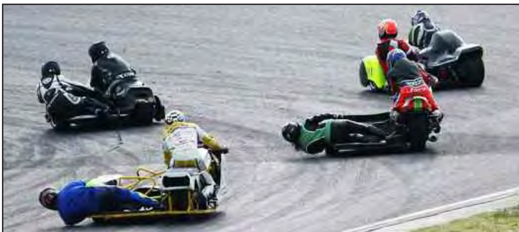
La tasca del copilot es primordial en les corbes, tal com es veu en l'imatge d'aquesta cursa

-L'afició a les motos sempre l'he tinguda, però amb la branca dels sidecars em vaig sentir una mica pressionada, perquè el meu marit, que s'hi dedicava, no disposava de cap noi