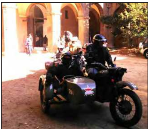
Vam sortir amb els sides a voltar per Manresa

Una vegada finalitzat, estem molt contents de com ha anat, ja que una cosa bastant minoritària ha tingut força públic, que ha tingut la oportunitat de veure també, afegit en l'esde-