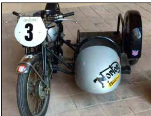
Norton 500 cc amb sidecar petit del 1936