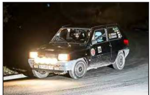
SEAT Panda dels Verdaguer, 2ns del grup S